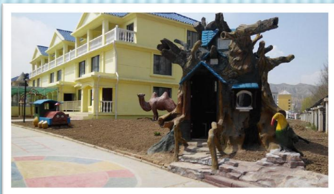
這是我工作的地方

現在我在幼兒園裡當課程顧問，這是神呼召我在此地的工作，為要建立一所分享主愛的幼兒園，我主要的工作是培訓老師和設計課程。同時在與老師們建立關係，希望日後有機會與她們分享福音。而幼兒園的課程，著重愛的教育，以主耶穌所教導的愛來服侍小朋友和家長，雖然不能說明，卻是以身作證，讓人感受到耶穌的愛。