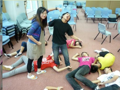
大力士參孫強勁臂彎