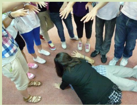
阿當.夏娃.禁果樹下